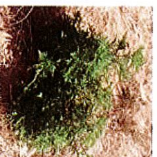
Stade végétatif Mai-Juillet