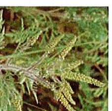
En fleur Août-Septembre

Son pollen, très allergisant, cause un problème majeur de santé publique. Les symptômes allergiques, comparables à ceux associés au « rhume des foins » (rhinite, conjonctivite, urticaire, eczéma...) peuvent entraîner l'apparition de l'asthme ou son aggravation.